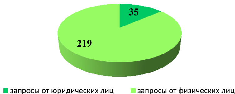
Диаграмма 3. Соотношение количества запросов, поступивших за 2016 год от юридических лиц, и запросов, поступивших от граждан.

Соотношение количества запросов, поступивших за 2016 год от юридических лиц и от граждан, показано в диаграмме 3.