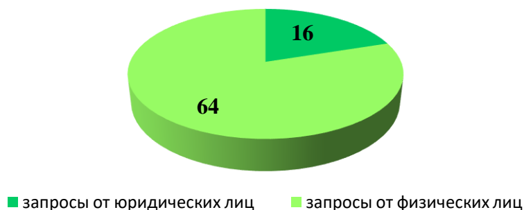
Диаграмма 3. Соотношение количества запросов, поступивших за 6 месяцев 2017 года от юридических лиц, и запросов, поступивших от граждан.

Соотношение количества запросов, поступивших за указанный период 2017 года от юридических лиц и от граждан, показано в диаграмме 3.