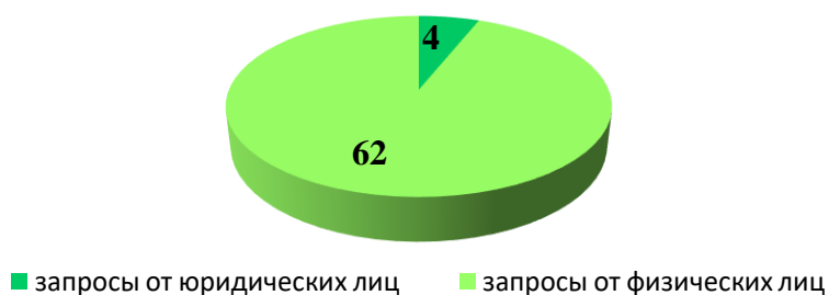
Диаграмма 3. Соотношение количества запросов, поступивших за 9 месяцев 2018 года от юридических лиц, и запросов, поступивших от граждан.

Соотношение количества запросов, поступивших за 9 месяцев 2018 года от юридических лиц и от граждан, показано в диаграмме 3.