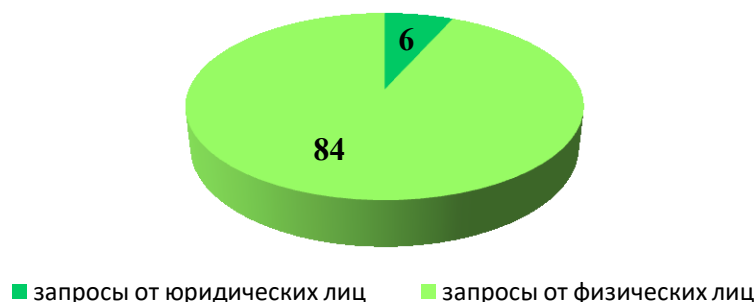
Диаграмма 3. Соотношение количества запросов, поступивших за 2018 год от юридических лиц, и запросов, поступивших от граждан.

Соотношение количества запросов, поступивших за 2018 года от юридических лиц и от граждан, показано в диаграмме 3.